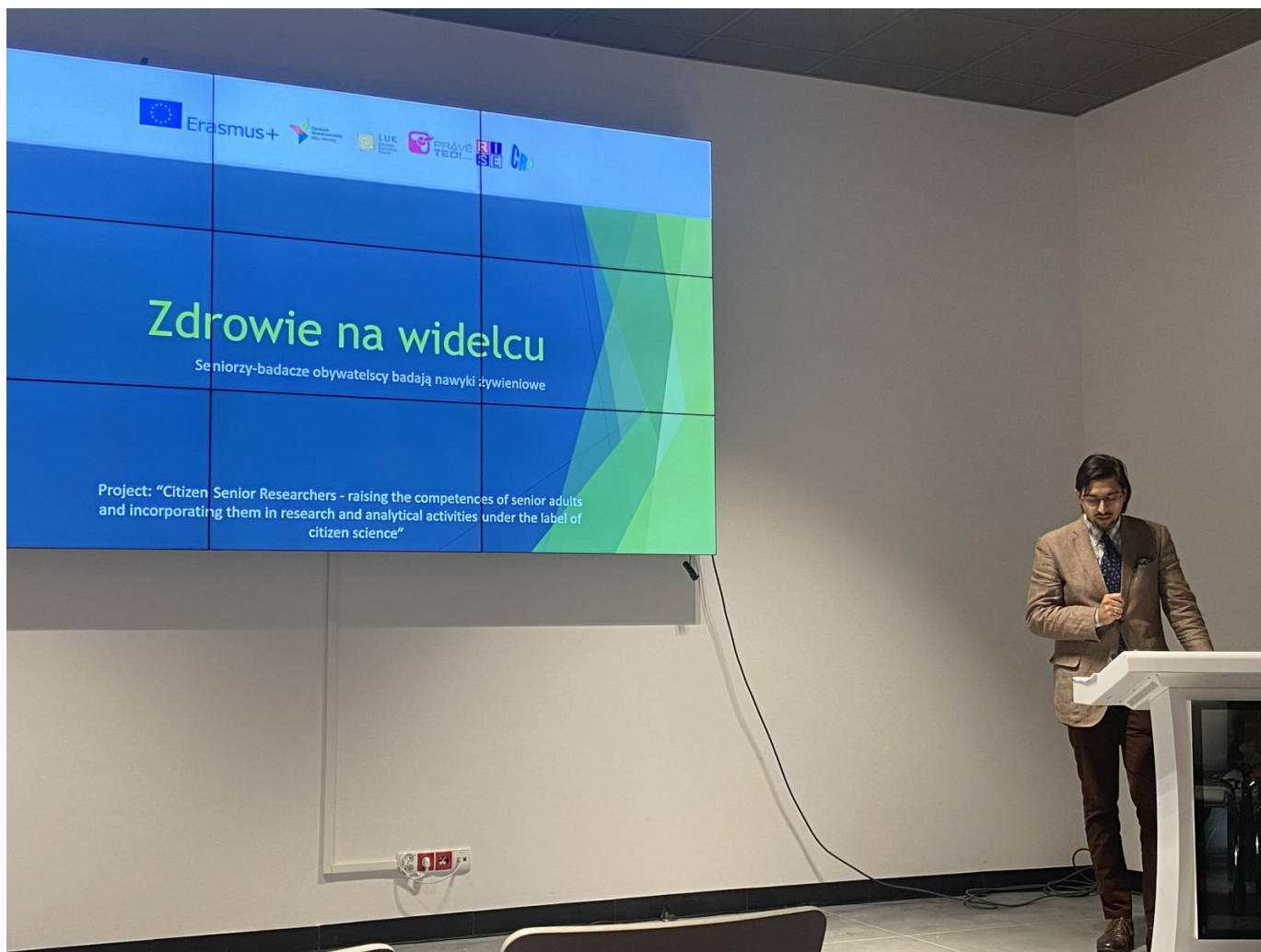
Grafika: Regionalny Ośrodek Polityki Społecznej w Toruniu